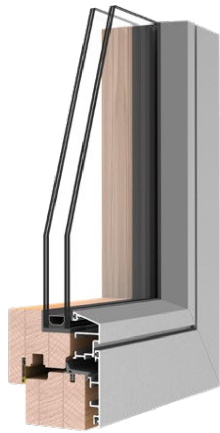
REQUADRO LINE U_w 1.2