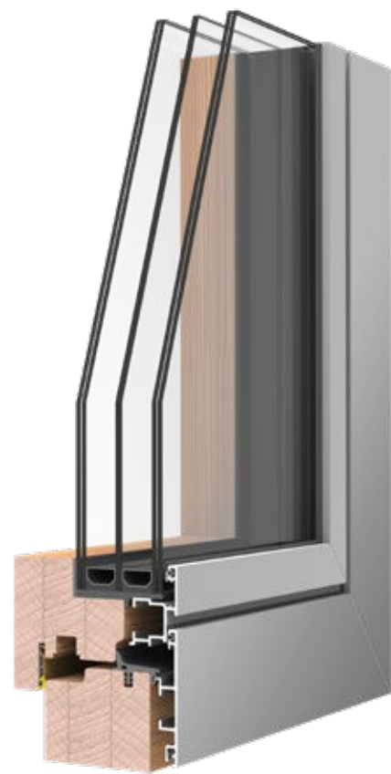
REQUADRO HPF U_w 0.8 ANTA ESTERNA COMPLANARE