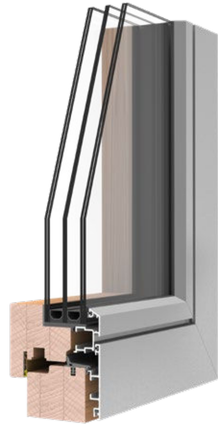
REQUADRO HPC U_w 0.8 CON TRIPLO VETRO